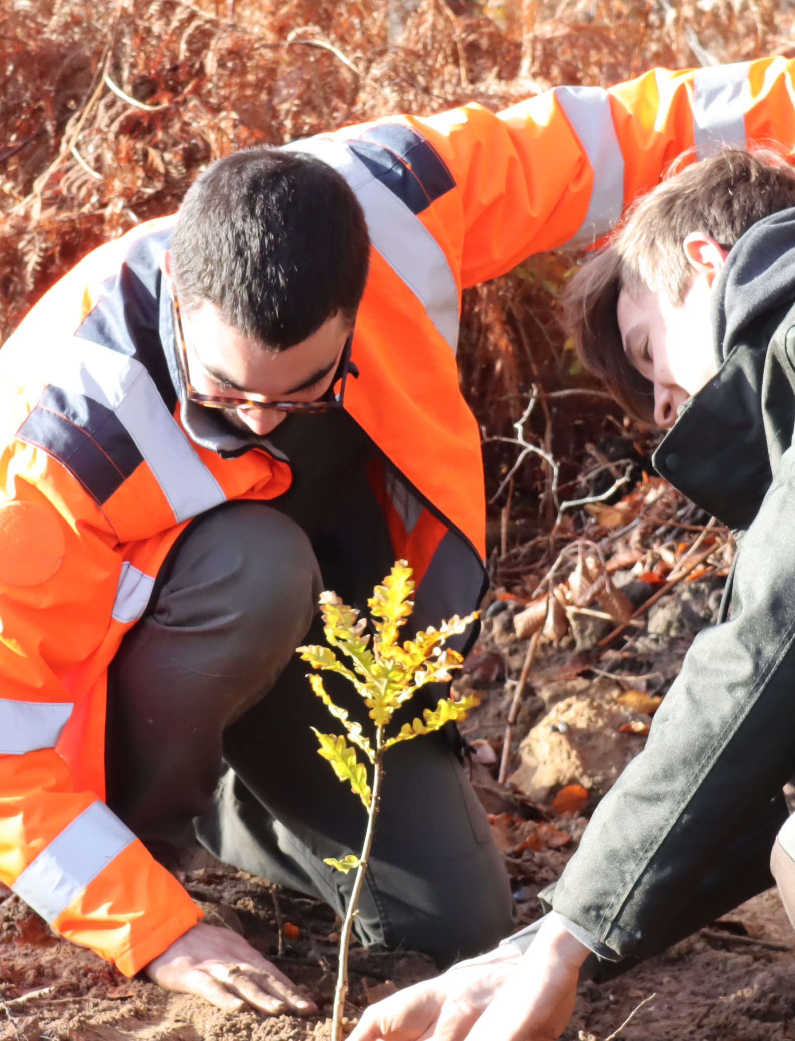
Chantier de plantation avec l'ONF et la Société de protection de la forêt de Compiègne (SPFC).